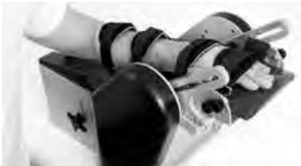
Рисунок 1 Прилад Нейрофлексор для вимірювання компонентів тонуусу м'язів

Пристрій «Нейрофлексор» працює наступним